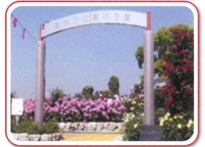
▼ バラ園(バラ:5月と10月) 180種 2400本