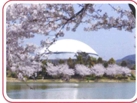
◀ 桜とかすやドーム (桜:3月下旬頃) 700本